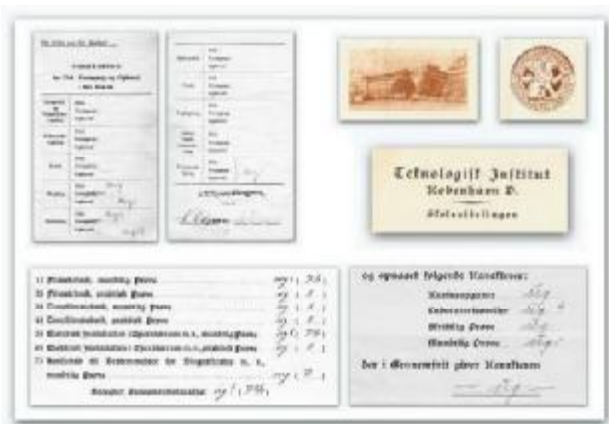
De meget fornemme eksamensbeviser er fra 12 maj 1939