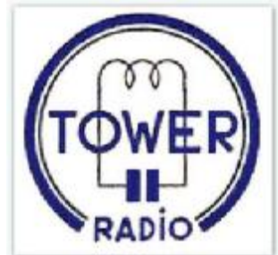
firmalogo fra 1945